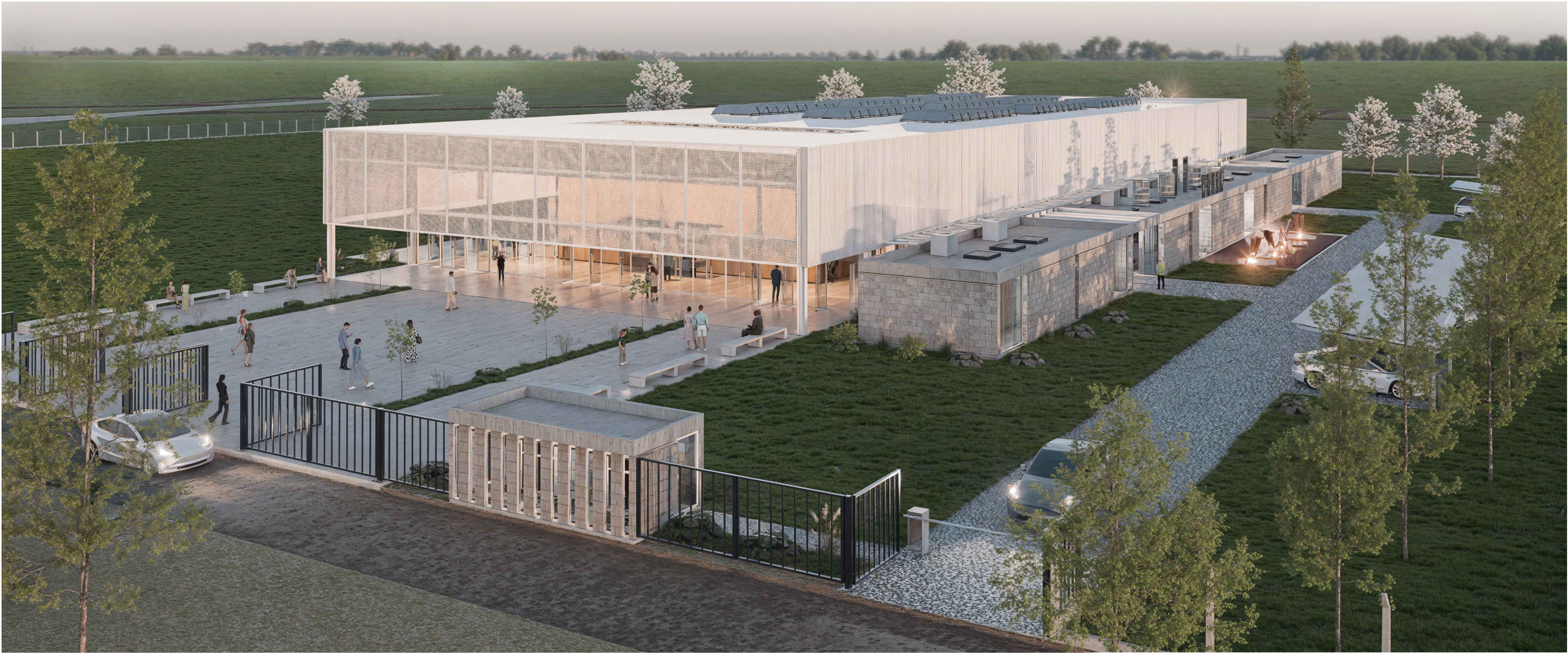
VOLUMETRÍA GENERAL DE LA PROPUESTA